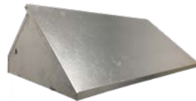
Couvercle en acier galvanisé N° : 960000