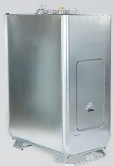
RÉSERVOIR 2 EN 1