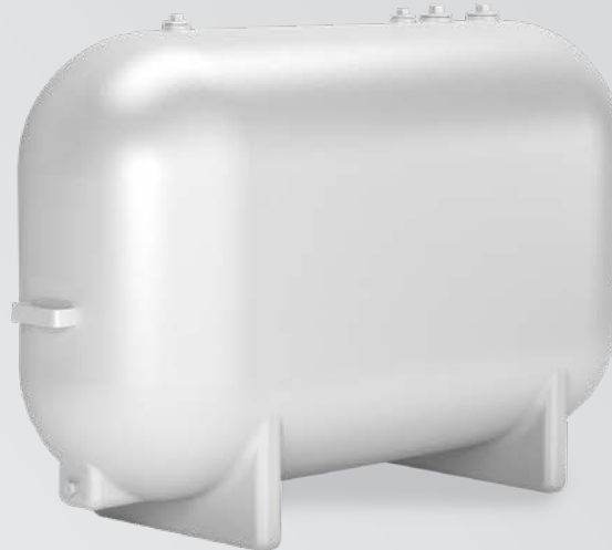
RÉSERVOIR EN FIBRE DE VERRE