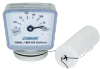
Indicateur de niveau d'huile N° : 962247 – 720 L / 962248 – 1000 L